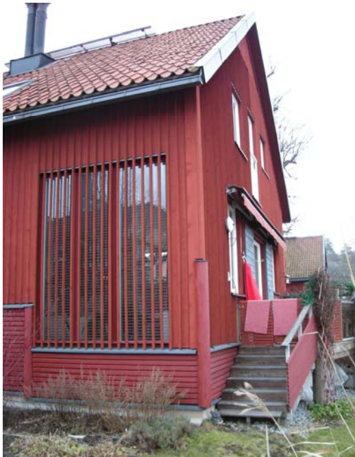
Exempel på traditionell, rektangulär huskropp med sadeltak målad med faluröd slamfärg. Ett större glasparti ger ljus till rummet och de överdragna locklisterna skyddar mot insyn. Locklisterna ger också effekten att glaset inte dominerar fasadytan.