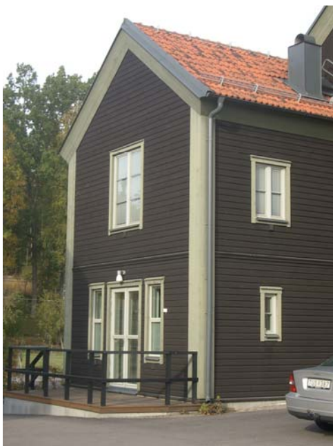
Exempel på traditionell, rektangulär huskropp med sadeltak. Fasadytan målad med svart slamfärg. Tak med schatterat rött lertegel.

Det är också ett mål att alla delar formas med hög kvalitet i materialval och utformning. Nedan visas några exempel vars lösningar ryms inom Glasberga Sjöstad.