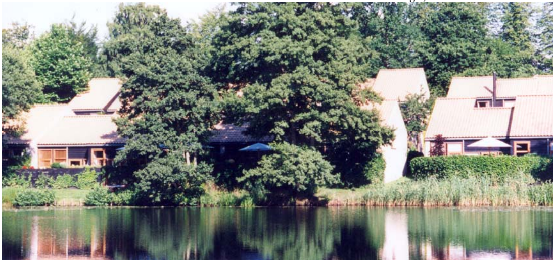
Bilden visar exempel på rektangulära huskroppar med sadeltak som sammanfogats till en väl sammanhållen helhet med stor variation, trots begränsat kulör- och materialval. Bebyggelsen karaktäriseras av ett lågmäلت och behärskat formspråk och har planerats så att befintliga stora träd bevarats. Materialkvaliteter är t ex taken av lertegel som åldras vackert, istället för t ex betongtakpannor. Stor exakthet i detaljutformning och öppningar bidrar till hög gestaltningskvalitet. Fönsters utformning och uteplatsers placering ger nära samband mellan inne- och uterum. Lägg också märke till att uteplatserna ligger diskret placerade nära marken och alltså inte bildar stora volymer med räcken runt.