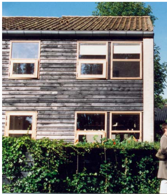
Exempel på traditionell rektangulär huskropp med sadeltak. Även här används svart kulör på fasad och rött lertegel på tak. Vår tids arkitektursyn kan återspeglas i t ex utformning av fönster och detaljer.