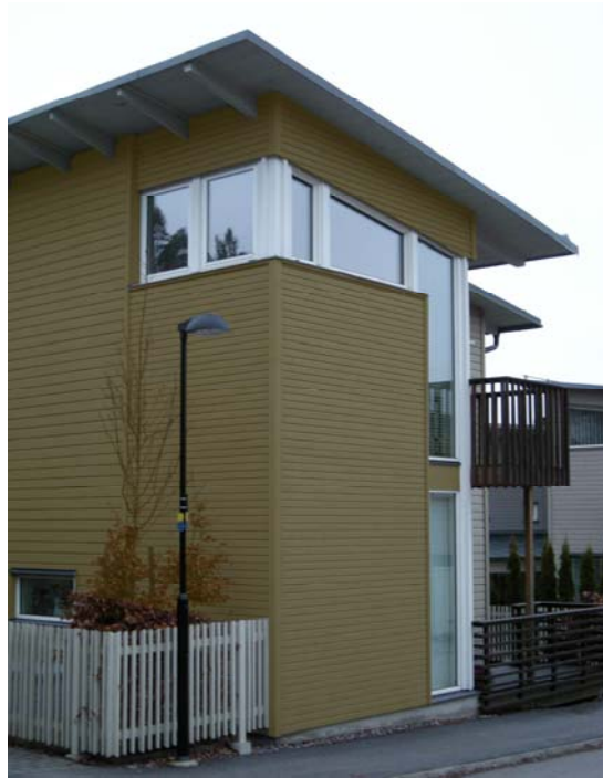
Exempel på rektangulär huskropp med pulpettak. Inslag av våningshöga glaspartier kan ge eftertraktat ljus och luft till ett rum men måste utformas med omsorg så att den slamfärgade träfasaden får dominera. Lägg också märke till balkongen som inte dominerar husvolymen eller bildar blickfång i gatubilden. (Detta hus har något lägre takvinkel än vad som tillåts i Glasberga).